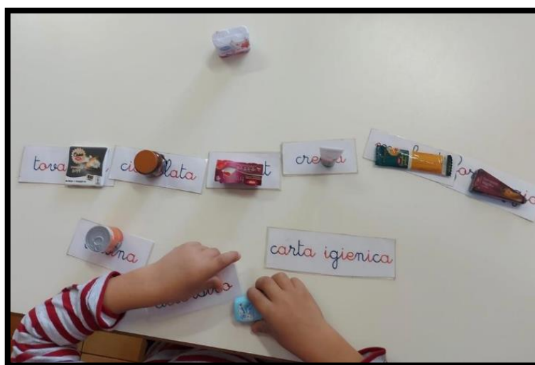
linguaggio - attività di associazione