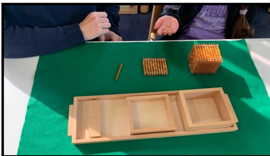
psicoaritmetica - perle delle unità, decine, centinaia e migliaia